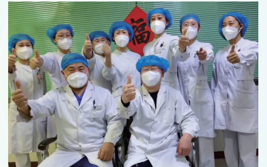
“我不能哭 因为眼镜会花 我不会哭 因为还有很多事要做” 小小的双手 大大的担当 请记住你们的模样！

疫情面前，20余天，有每一位医护人员的坚守，有每一位患者的坚强，有每一位一线工作者的风险，关节二科定能战胜它。大地阳和，万物苏萌，律回岁晚，春到人间，愿东风吹走所有阴霾，静待天地祥和，共赏春之美景！