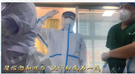
用信念和担当 坚守防疫第一线

20多公斤 是一身装备的重量 一桶药水喷完 衣服就已经湿透 可以拧出水来 3万多分钟 是坚守一线的时间 不管是勇毅奋战的倔强 还是驱散不安的阴霾 从未停下坚定的脚步 纵使筋疲力尽 依旧坚持到底