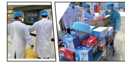
Welcome to my world!

在这场抗击疫情的持久战中，有人冲锋在前护卫人民健康，就有人在后方传递温暖全力支持，一份份温暖的物资，一幕幕暖心的画面，再次共同见证了我院工会的坚韧与温情，家人们别怕，我们守你无恙！